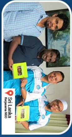
Sri Lanka Kegiatan MSB